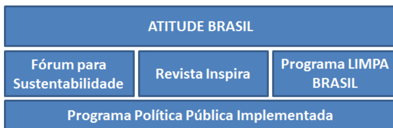
Figura 1 - Estrutura dos programas associados à ATITUDE BRASIL .