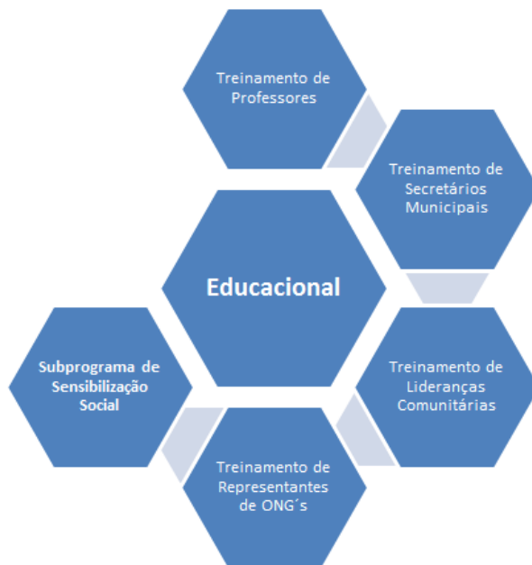
Figura 3 - Eixos do Subprograma Educacional

Neste subprograma serão concentrados todos os projetos voltados ao treinamento, capacitação e sensibilização para o todos os públicos envolvidos no programa.