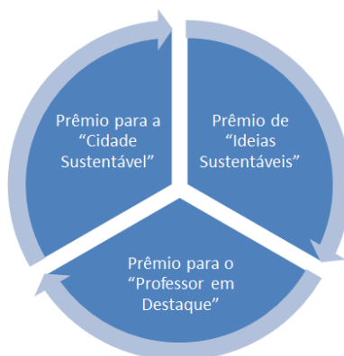
Figura 5 - A estrutura do subprograma "Coleta Seletiva de Boas Ideias".

Segmentamos a iniciativa em quatro principais verticais: